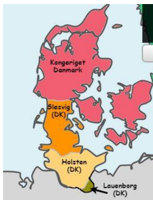
De tabte områder.

Krigen i 1864 bliver kaldt den 2.- Sleviske krig, og den blev udkæmpet mellem på den ene side Preussen og Østrig og på den anden side Danmark i tiden 1. februar – 20. juli 1864. Danmark tabte, og måtte afstå hertugdømmerne Holsten, Lauenborg og Slesvig (= Sønderjylland). Det svarede arealmæssigt til 2/5 af riget der blev tabt, og befolkningsmæssigt blev Danmark reduceret fra 2,8 mill. Indbyggere til 1,7 mill. Indbyggere.