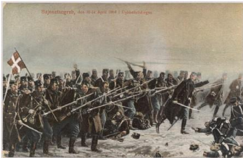
Bajonetangreb den 18. april 1864 i Dybbøllstillingen. Brevkort. Fra Det Kongelige Bibliotek

Jeg har fundet frem til en hel del personer, og der kan naturligvis sagtens være flere, som jeg ikke har kendskab til.