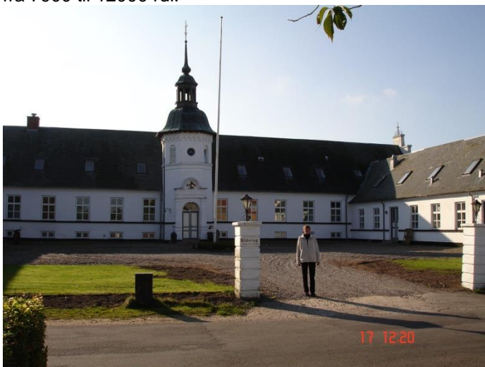
Blidstrup Gods. I forgrunden Inger.

Moustrup gods på Mors blev udbygget og forbedret flere gange fra 1853 til 1857. Forsikringssummen for stuehuset hævedes i 1855 fra 1700 til 3000 rdl. og i 1857 til 5000 rdl. I 1857 udvidedes stuehuset med 5 fag, der også rummede kælder. Da de andre dele af gården ligeledes blev forbedret, øgedes forsikringssummen fra 7900 til 12000 rdl.