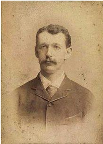
Mogens Frijs. Fra Tom Buk-Swientys bog

Mogens Christian lensgreve Krag-Juel-Vind-Frijs var en dansk godsejer og politiker. Han var kendt som grev Mogens Frijs til Frijsenborg.