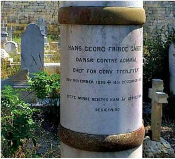
Mindestenen på militærgravpladsen i Valletta på Malta