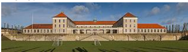
Viborg Katedralskole. Grundlagt omkr. 1100