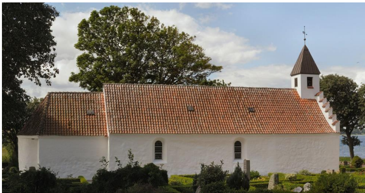
Knebel kirke.