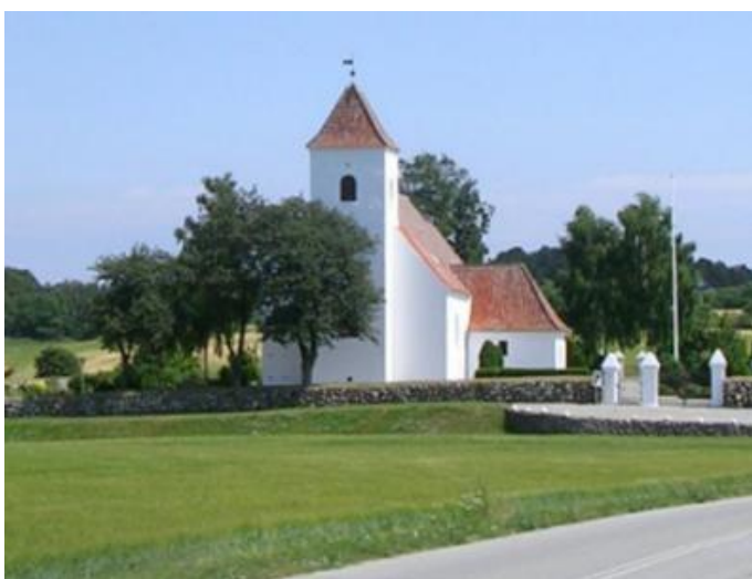
Vistoft kirke.