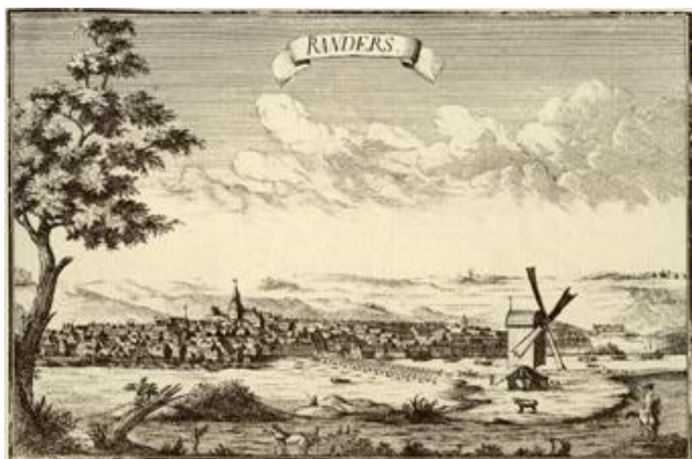
Prospekt over Randers fra Dansk Center for Byhistorie