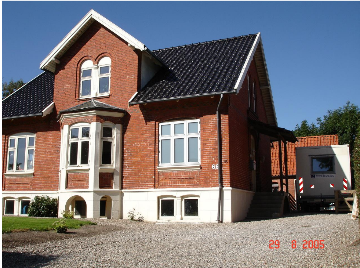
Hanses hus i Kosterlev. Foto: Arne Bjørn Jørgensen, 2005