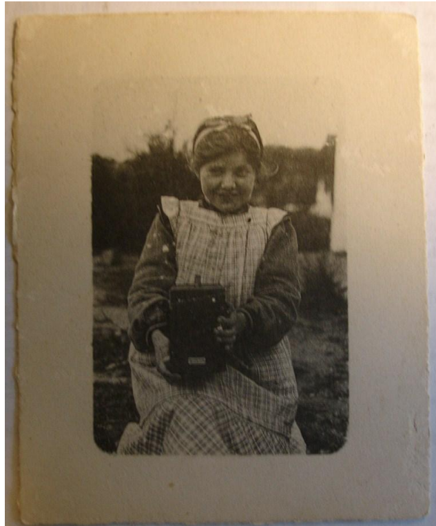
Forsiden af kortet