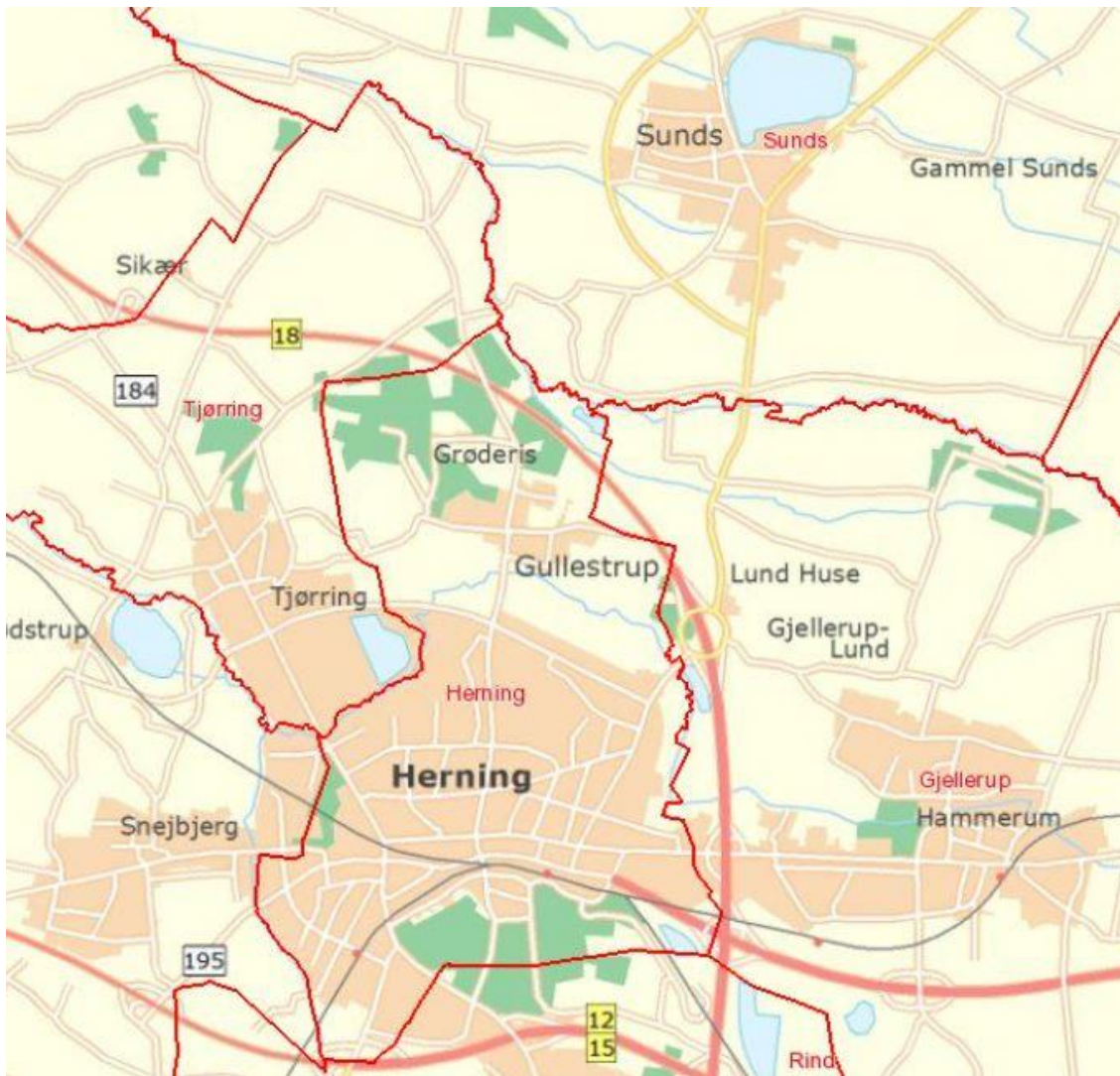
Det Kongelige Bibliotek: historiske kort. Herning, Tjørring, Snebjerg og Sunds