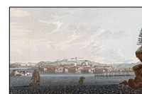
Trondheim Malet af John William Edy (1800)