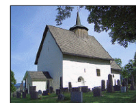
Bø kirke i Telemarken