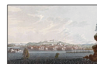
Trondheim Malet af John William Edy (1800)