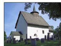
Bø kirke i Telemarken