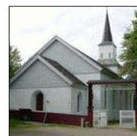
For Kirke i Stod i Norge Fre Kirkesøg, Kirkebygdatabasen.