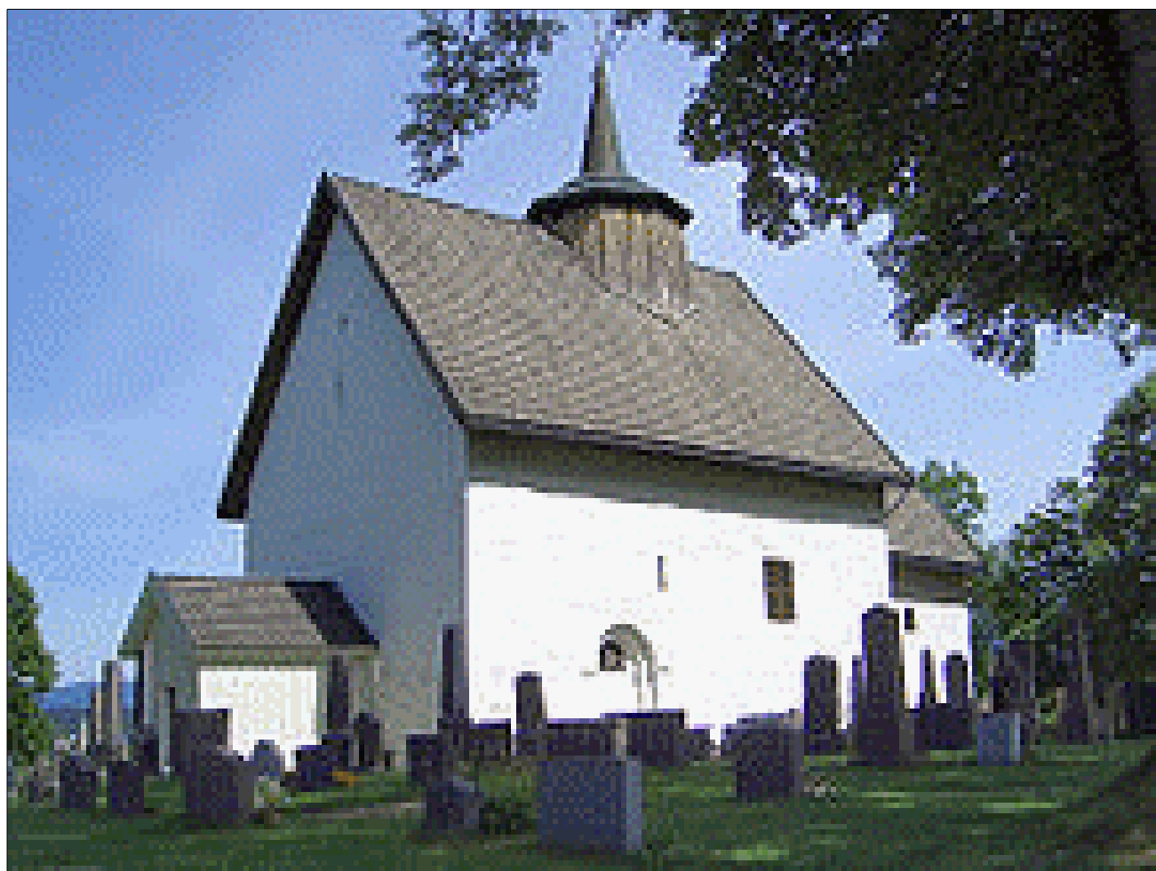
Bø kirke i Telemarken - den er fra 1100 tallet