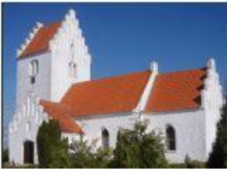
Nørre Asmindrup kirke.