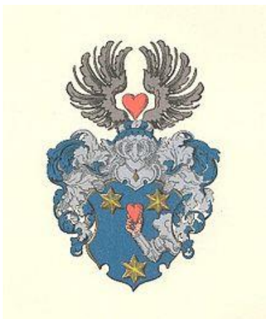
Familien Plums våbenskjold