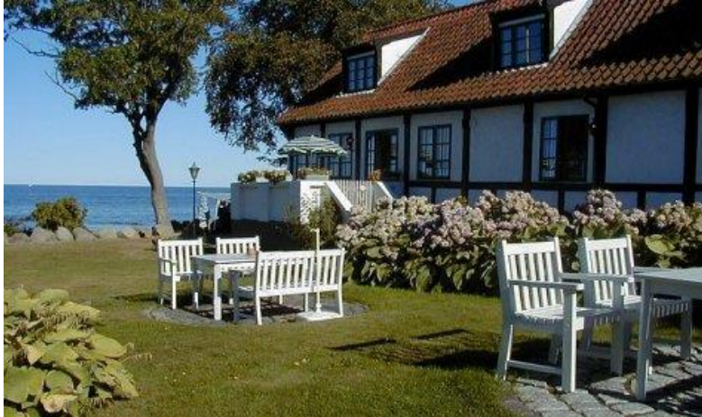
Byskrivergården i Allinge

Regiment., 10. Feb. 1816 ved 2. Livregiment, 9- Apr. 1817 cand. jur. (h. h.), 26. Nov. 1822 Premierløjtnant ved 2. Livregiment., 24. Jan. 1827 Byskriver i Hasle, Herredsskriver i Nordre Herred og Birkeskriver i Hammershus Birk, 31. Jan. s. A. Krigsråd, 23. Okt. 1835 Byfoged i Rønne og Herredsfoged i Vester Herred., 15. Sep. 1851 virkelig Justitsråd, 21. Nov. 1856 kgl. Raadmand samt By- og Rådstueskriver i Helsingør, 13. juni 1870 (fra 30. s. M.) Afskediget, 20. Sep. s. A. frasagt sig Titlen som virkelig Justitsråd. — R. St. A. 3.