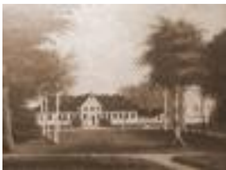
Tiselholt i 1820

Tiselholt Gods er på 253,3 hektar. Senere var han grosserer og ejede gården Nøragergård.