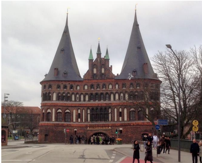
Holsteiner Tor i Lübeck.

Grote Iven Krummedige beseglede 1297 dokument sammen med Greve Johan, og tjente i år 1298 blandt Staden Lübecks lejetropper. Han blev 1300 af Bispen af Lübeck anklaget for Paven for at have øvet overgreb mod en Kannik.