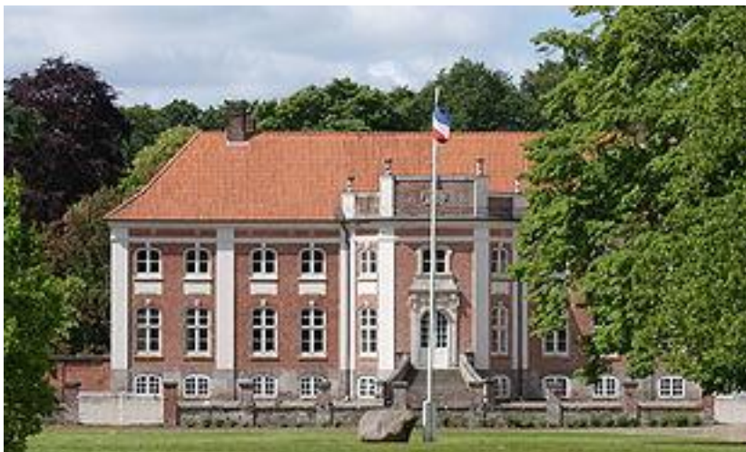
Rundtoft – på tysk Rundhof

Gift med Cecilie Skram til Rundtoft (født 1342). Skriver sig til Mehlbeck og Løgismose. I år 1393 udstedtes et vidne om at han i sin tid med ære udløste sig af dansk Fangenskab.