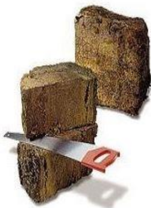
Klyner. Fra reklame på nettet.