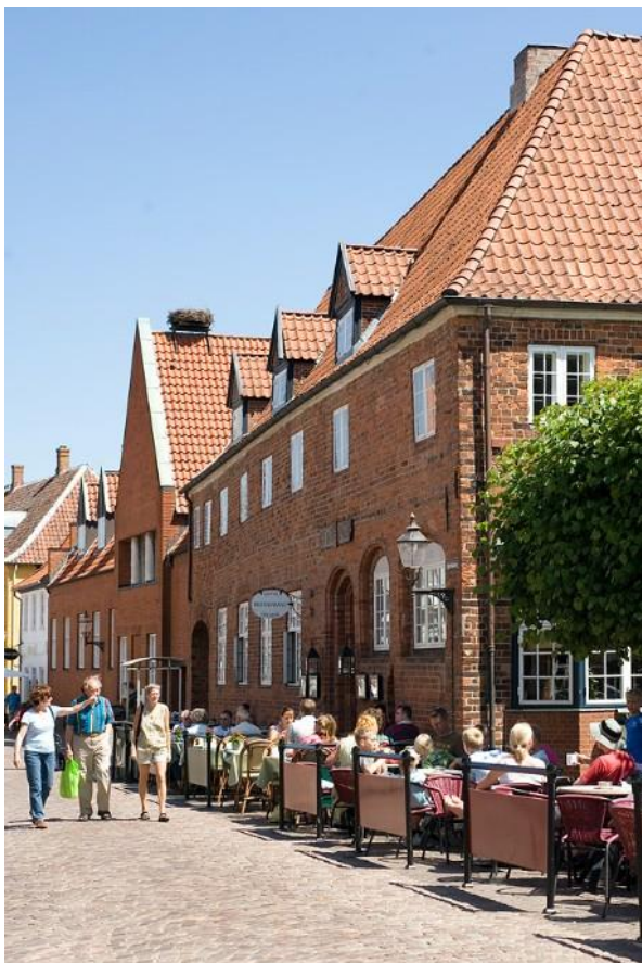
Dagmars hotel på Torvet i Ribe.

De boede i en stor gård på torvet i Ribe, og den blev senere kendt som Gæstgivergården.