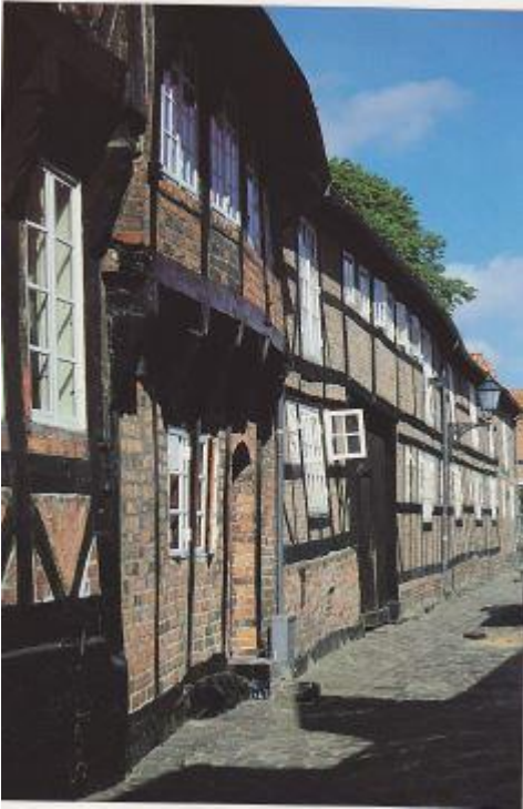
Stemningsbillede fra Ribe

død i 1577 var han borgmester i Ribe. Faderen Søren var meget rig, og i 1569 var han den højest beskattede borger i Ribe.