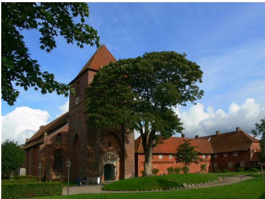
Sankt Katharine kirke i Ribe