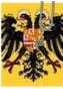
Klynes våbenskjold.