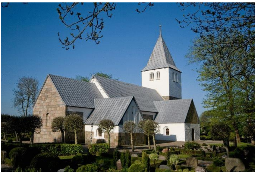
Nors kirke. Fra Nors sogns webside