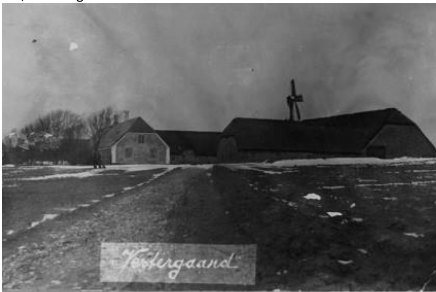
Vestergård i Nors sogn