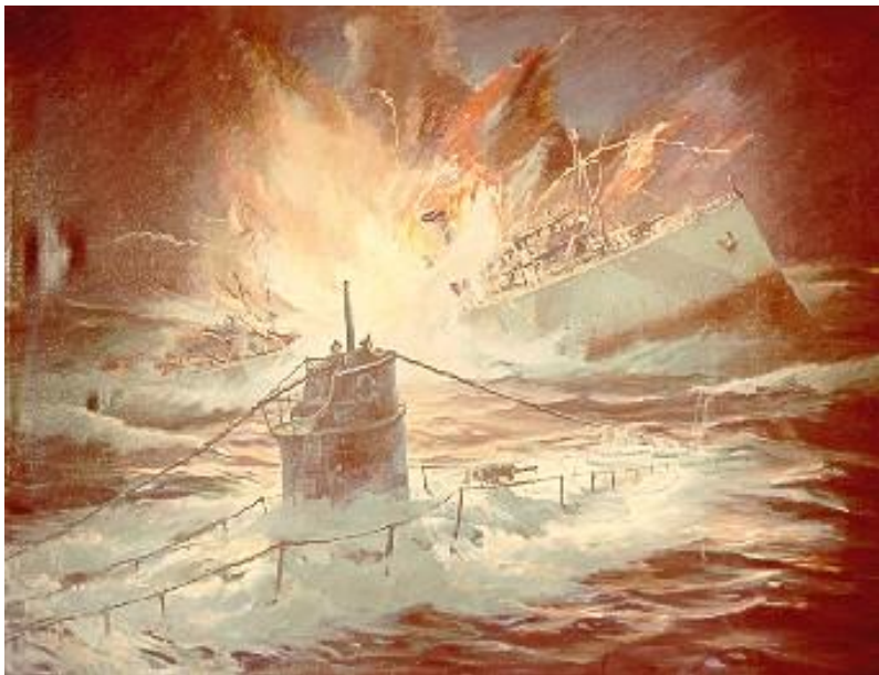
Tampa torpederes af UB91 og synker. Rekonstrueret billede fra U.S. Coast Guards hjemmeside

Det var en mørk, kold og stormfuld nat, da den amerikanske kystbevogtningskutter Tampa sejlede i spidsen for en konvoj ud for Wales kyster. Kl. 8:45 blev der fra andre skibe rapporteret om en høj eksplosion, og efterfølgende kom Tampa ikke i havn. Der blev sat en eftersøgning i gang, og man fandt 2 lig. Hele Tampas besætning på 115 personer omkom, og dertil kom 16 passagerer, som også omkom. Det var det største tab for U.S. flåde i hele 1. verdenskrig.