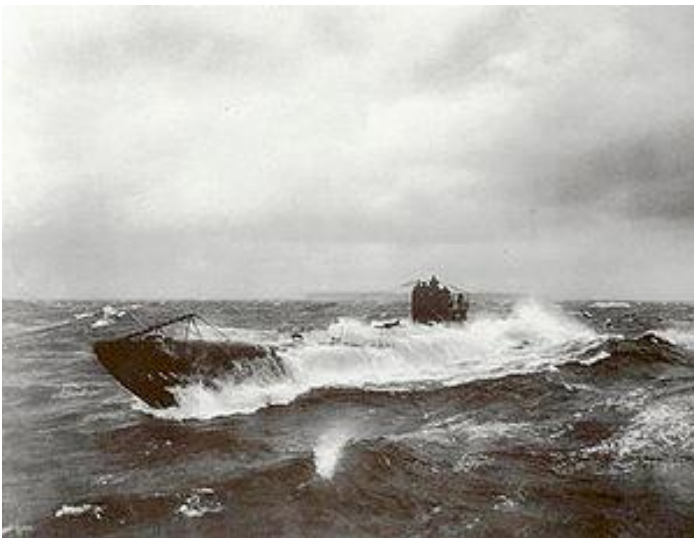
Den tyske u-båd UB91.

Tæt på slutningen af krigen, nemlig den 26. september 1918 – for 98 år siden – skete katastrofen.