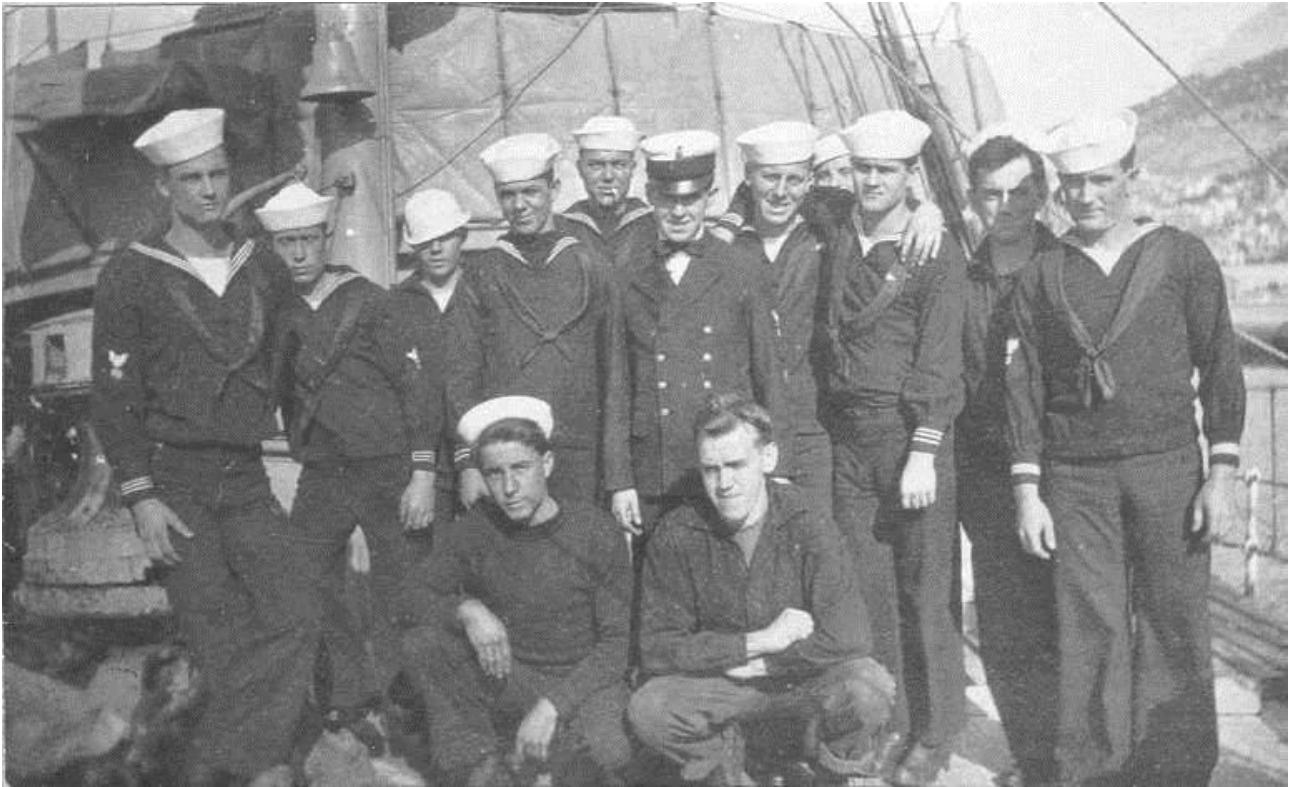
Søfolk på Tampa i 1918 – måske er Vilhelm imellem dem?