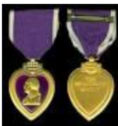
Purple Heart medaljen.