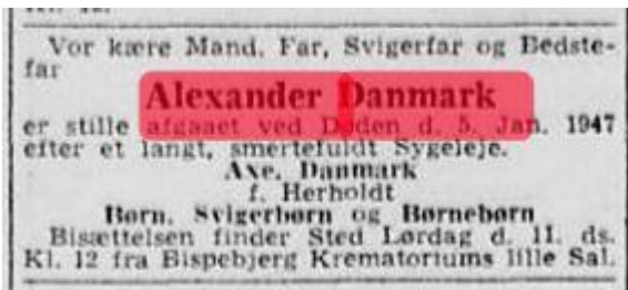
Dødsannoncen fra Politiken

Ved sin død betegnes han som kontorassistent.