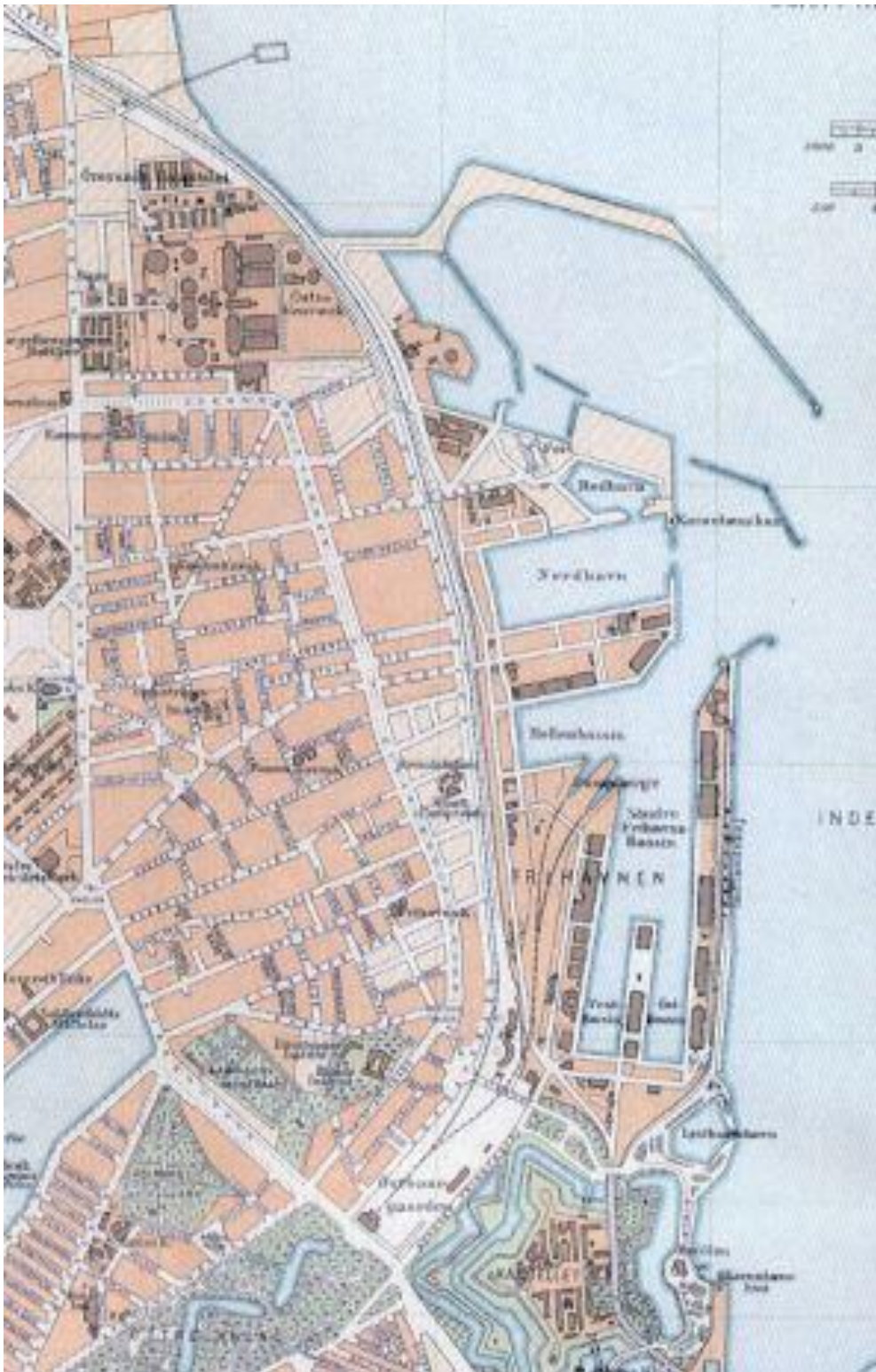
Østerbro 1906