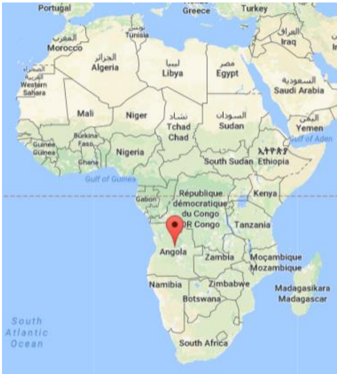
Afrika med Angola markeret.