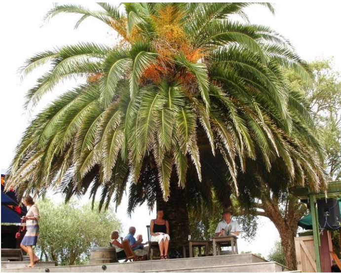
Auckland, New Zealand.

I 1914 brød 1. verdenskrig ud. Samoa var domineret af englænderne, og de tvang derfor i 1915 alle tyskerne til at forlade Samoa. Georg flyttede i første omgang til Auckland i New Zealand, og efterfølgende omkring 1916 til Java.