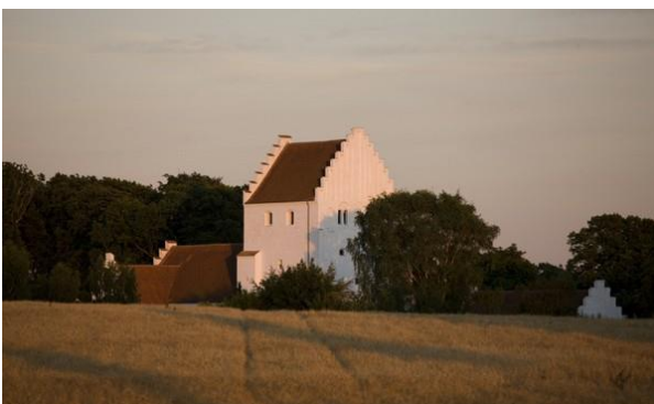
Tranebjerg kirke på Samsø.